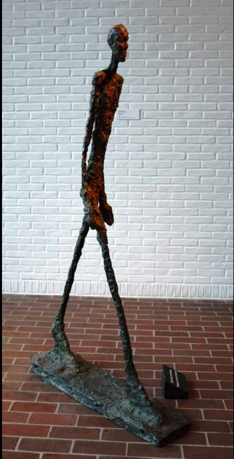
ALBERTO GIACOMETTI GÅENDE MAND [1960]